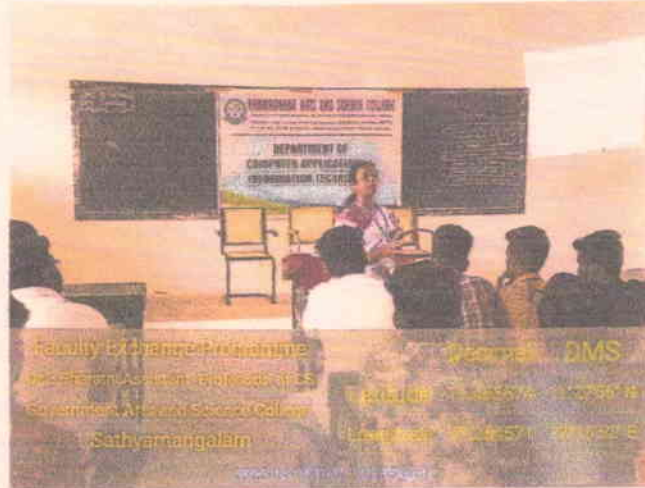
Student gives feedback about the class